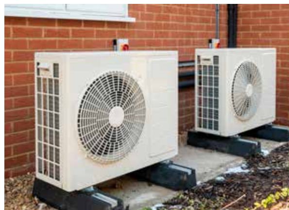
Une pompe à chaleur extrait la chaleur de l'environnement.

Inconvénients : Par temps froid, la pompe à chaleur n'aura pas assez de puissance pour chauffer agréablement une habitation moyennement isolée. Si l'habitation ne fonctionne pas avec une température de sortie basse, la pompe à chaleur affichera un rendement moindre et vous consommerez plus d'électricité. Dans ce cas, la chaudière à gaz prendra le relais, ce qui augmentera la consommation de gaz, ainsi que les émissions de CO 2 .