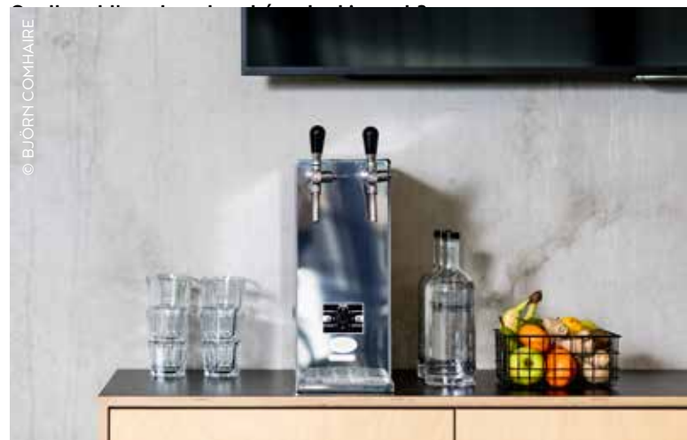
Robinetto fabrique des robinets qui filtrent l'eau de ville, la refroidissent et la carbonisent éventuellement.

Une fois cette étape franchie, j'ai poursuivi mes recherches. Que contiennent ces gobelets ? Nous avons tenté l'expérience du Boombar : un bar dans lequel nous avons combiné toutes les techniques et idées en matière de durabilité. Le bar le plus durable au monde ! La réponse a été unanime : on m'a encouragé à créer davantage de bars de ce type et à y associer une entreprise. Je trouvais que c'était un bon plan, mais j'ai finalement décidé de ne pas tout faire en même temps. Avec Robinetto, nous allons d'abord nous concentrer sur une chose : l'eau du robinet en tant qu'eau potable. C'était la chose la plus simple de tout le bar, mais elle avait en même temps un impact retentissant. »