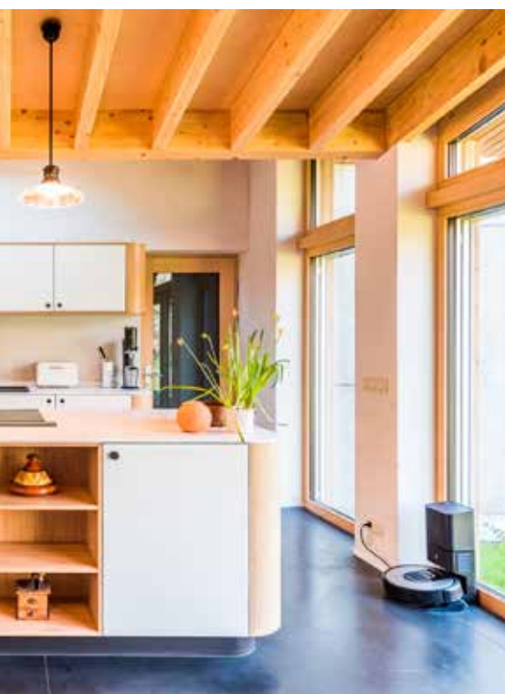
Meubles Atelier Timmerwerkt fabrique meubles et cuisines sur mesure pour ces clients.

Vous caressez le projet de créer votre propre entreprise ? Discutez-en en temps utile avec votre courtier en assurances.